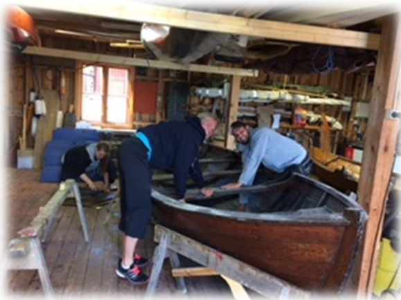
V: Vårpuss med optimisme

Livet i småbåtbua har stort sett vært bra i 2017, og båtene har kommet på vannet, i bruk og på land i rimelig tid. Det er aldri noe problem å få folk til å bære og dra båter som skal på land eller vann, eller mellom sheddet og småbåtbua for reparasjon, vedlikehold eller oppbevaring. Verre er det med vedlikeholdsarbeidet hvor det er konkurranse med andre kanskje mer spennende aktiviteter og kurs. Denne høsten og vinteren har vi fire sjekter i småbåtbua som trenger ekstra mye behandling. Tre av dem er nye i kystlaget, mens den fjerde er vår trofaste sliter «Augland» som ligger til allmenhetens benyttelse ved Pers brygge i Auglandsbukta. Det var på tide at «Augland» fikk litt ekstra oppmerksomhet og at det blir gjort en grundig jobb på henne. De tre andre var det veldig mye som måtte gjøres på. Dette arbeidet er morsomt, en spennende utfordring og en avveksling fra bare «pusse, skrape og olje». Men, vi bør vurdere nøyer hvor mange slike prosjekter vi har kapasitet til for det gjør det desto mer travelt med å få alle de andre båtene klare til neste sesong. Deler av arbeidet har blitt organisert som kurset "vedlikehold og stell av åpne, tradisjonelle trebåter", med hele åtte deltakere. Kursholder var Tore Berntsen.