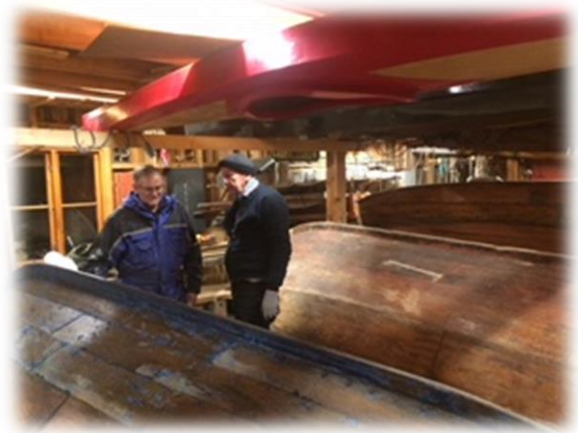
H: Betenkte, men fremdeles optimister

Vi har sett det som viktig for alle båtene at de kommer på vannet og i bruk. Vi skulle kanskje likevel tenke på om vi skal sette alle på vannet hvert år. Puttene er de mest populære båtene og de som får mest slitasje i løpet av sommeren. Skulle gjerne visst hvor mange som har hatt glede av dem og som lært å ro i dem. Heldigvis har RIO i hovedsak tatt seg av vedlikeholdet av disse. I Augland, ved Pers brygge, har vi som vanlig hatt "Augland" liggende for alles bruk. I museumshavna i Nodeviga har vi hatt "Trygve Lie" og "Åvik" (også med seil) klar til bruk for alle.