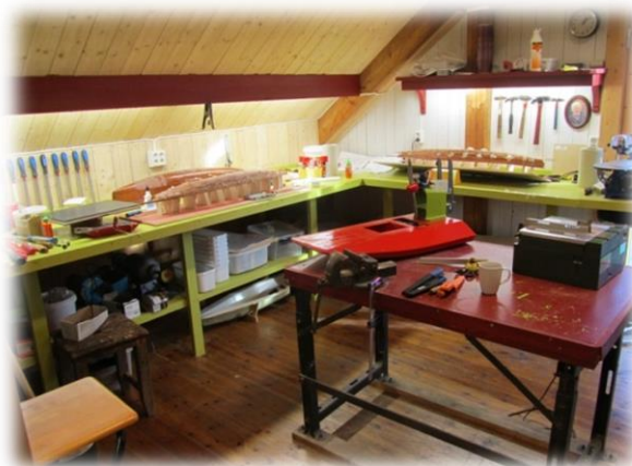
H: Et godt modellverksted